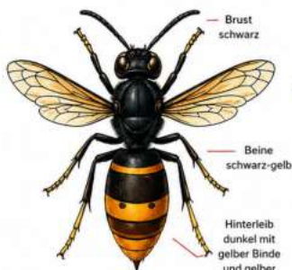
ASIATISCHE HORNISSE (Vespa velutina nigrithorax)