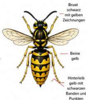
GEMEINE WESPE (Vespula vulgaris)